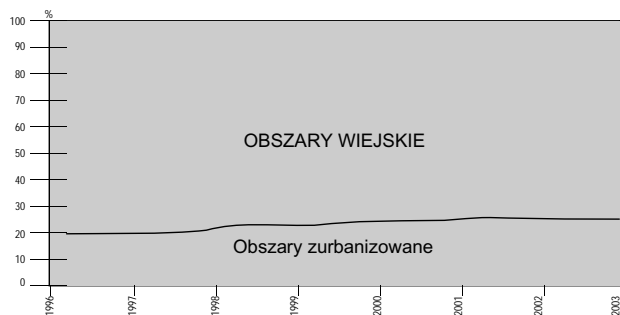
Wykres 3. Struktura zasobów rynku pracy w %